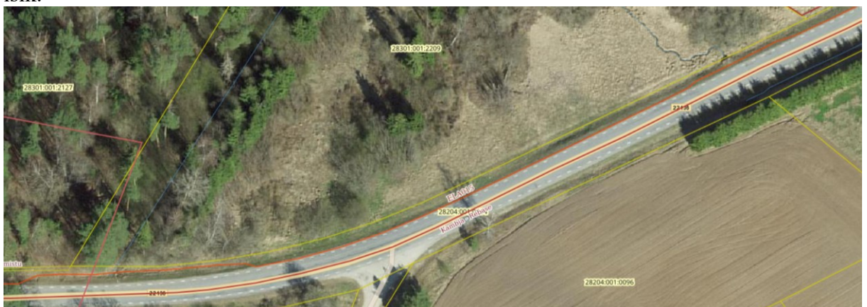
Joonis nr 2. Side maakaabel teemaal.

Palume pöörduda EESTI LAIRIBA ARENDUSE SA poole kirjaliku kooskõlastuse saamiseks. Kooskõlastus ja geodeetiline alusplaan esitada meile maantee@transpordiamet.ee , mille järgselt kaalume ristumiskoha ehitamiseks näidislahendusega lepingu väljastamist. Kui näidislahendust kasutada ei saa, tuleb koostada nõuete alusel punktis 3 nimetatud teeprojekt. Ristumiskoha ehitamiseks (nii näidislahenduse kui projekti alusel) sõlmime huvitatud isikuga ristumiskoha ehitamise lepingu ning ehitamise kulud kannab huvitatud isik.