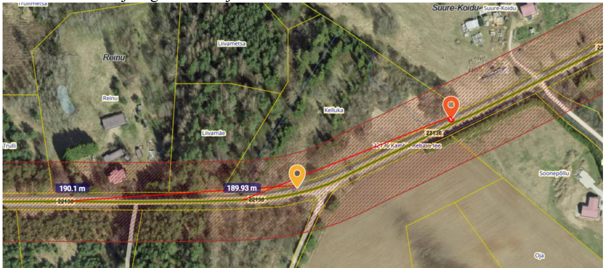
Joonis 1. Ristumiskoha võimalikud asukohad tähistatud oranži ja punase tingmärgiga.